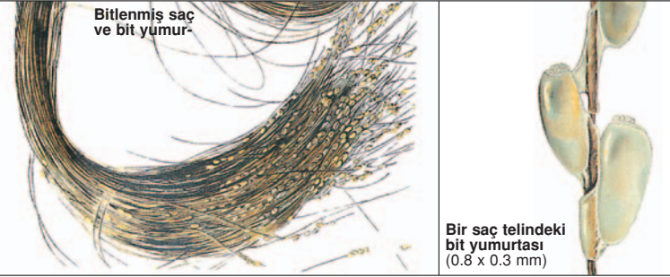
Bitlenmiş saç ve bit yumurtası

GOLDGEIST® FORTE, Etken madde: Piretrum ekstresi. Risk ve yan etkiler için lütfen prospektüsü okuyunuz ve doktorunuza veya eczanenize danışınız.