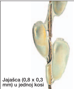
Jajašca (0,8 x 0,3 mm) u jednoj kosi