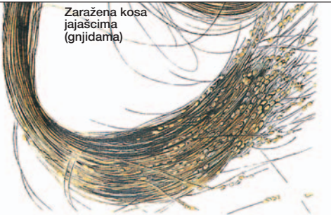
Zaražena kosa jajascima (gnjidama)

Glavena vaš najviše voli temperaturu koja vlada u kosi, a to je oko 28 °C. Na temperaturama oko 22 °C usporava se razvoj, koji skoro prestaje na temperaturi od oko 10 °C. Na temperaturi ispod 12 °C više ne nosi jaja. Ženka glavene vaši lepi jaja (gnjide) kao biserne lance pomoću vrlo otpornog lepljivog sekreta najčešće za koren kose. Gnjide se ne mogu iščešljati niti isprati vodom. 8 1/2 dana posle polaganja jaja izlazi larva. Tokom dodatnih 8 1/2 dana ona prolazi kroz tri razvojne faze. Jedan do dva dana posle treće promene kože muške i ženske glavene vaši su polno zrele, tako da otprilike 3 nedelje posle polaganja jaja može da nastane nova generacija. Muška glavena vaš živi oko 15 dana, dok ženska glavena vaš živi ca. 30-35 dana. U tom periodu oplodena ženka polaže dnevno do 4 jajeta, što znači ukupno oko 100 jaja.