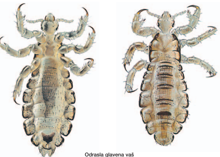
Odrasla glavena vaš Ženka sa trbušne strane (2,6-3,1 mm)