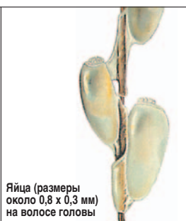
Яйца (размеры около 0,8 x 0,3 мм) на волосе головы