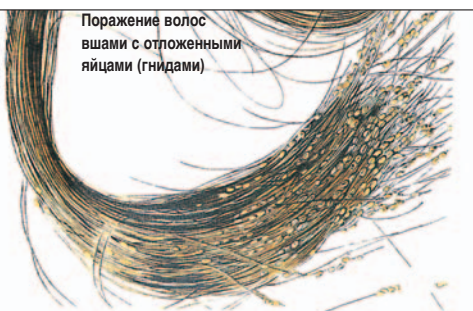
Поражение волос вшами с отложенными яйцами (гнидами)

Через 8 с половиной дней после кладки яиц из гниды появляется личинка. Она претерпевает в последующие 8 с половиной дней три стадии своего эволюционного развития. Через один-два дня после третьей стадии развития из личинок появляются мужские и женские особи головной вши достигшие половой зрелости, поэтому новое поколение головных вшей может возникнуть уже через три недели после откладывания яиц. Самец головной вши живет около 15 дней, в то время как самка примерно 30-35 дней. За это время оплодотворенная самка вши способна откладывать до четырех яиц ежедневно, а всего за период своего существования около сотни яиц.